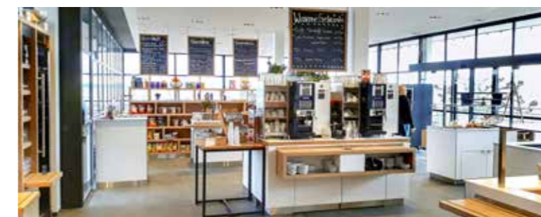
Das Restaurant Strandbad wurde innen aufgefrischt, die Fenster abgedichtet.

Bereits seit Anfang März ist das Restaurant Strandbad wieder geöffnet. Die Erneuerungsarbeiten im Gasträum und im Selbstbedienungsbereich wurden rechtzeitig abgeschlossen. Das Restaurant wirkt nun heller und einladender. Ausserdem wurden die Fensterfronten abgedichtet. So lässt sich nun auch an kühleren Tagen die Gastfreundschaft des Teams im Restaurant geniessen.