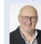
Ueli Nägeli, SVP-Parlamentarier, Arbon

Es liegt jetzt am zukünftigen politischen Gremium der Stadt Arbon, diesen Entscheid nochmals zu prüfen und gegebenenfalls zu korrigieren.