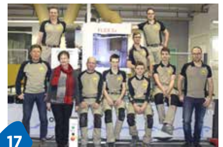
Schulen schreiben schwarz