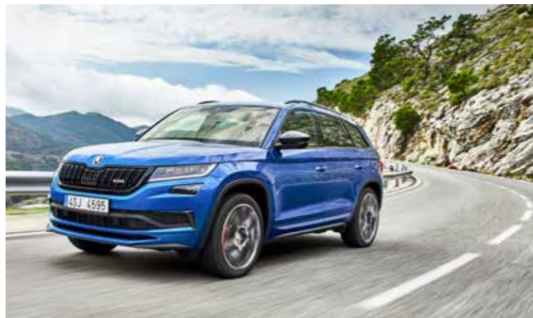
Der «Škoda Kodiaq RS»: Aussergewöhnliche Dynamik und hohe Alltagstauglichkeit zeichnen ihn aus.

Mit interessanten Fahrzeugmodellen starten die Elite Garage Arbon und Škoda in den Frühling. An der Frühlingsmesse wird unter anderen der «Kodiaq RS» präsentiert, erstes SUV in der Rallye Sport(RS)-Familie. Es verbindet die Eigenschaften eines sportlichen Langstreckenfahrzeugs mit denen eines robusten und sicheren Familien-Transporters. Weiter können Interessenten an der «Messe am See» das Sondermodell «Octavia Soleil» mit Zusatzoptionen zum besten Preis kennenlernen sowie von Lagerprämien auf Lagerfahrzeuge und vom Messerabatt für einen Neuwagenkauf profitieren.