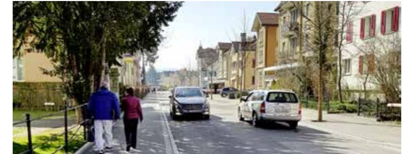
Die Verkehrsmessung 2019 ergab leicht erhöhte Werte im Vergleich zu 2017.

Aktuelle Verkehrsmessungen auf der Landquartstrasse in Arbon zeigen, dass zwar das Verkehrsvolumen insgesamt etwas zugenommen hat, der Anteil an LKWs hingegen leicht gesunken ist. Festgestellt wurde zudem ein leichter Anstieg der Durchschnittsgeschwindigkeit der Fahrzeuge.