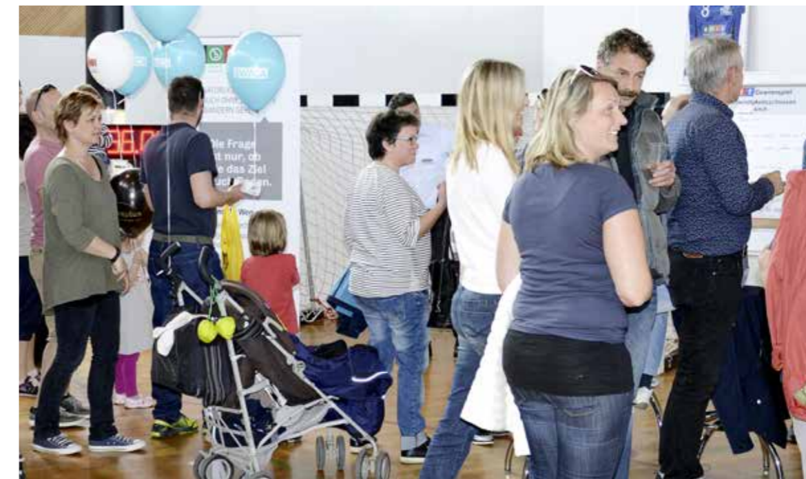
Impressionen von der letzten «Messe am See» im Seeparksaal.