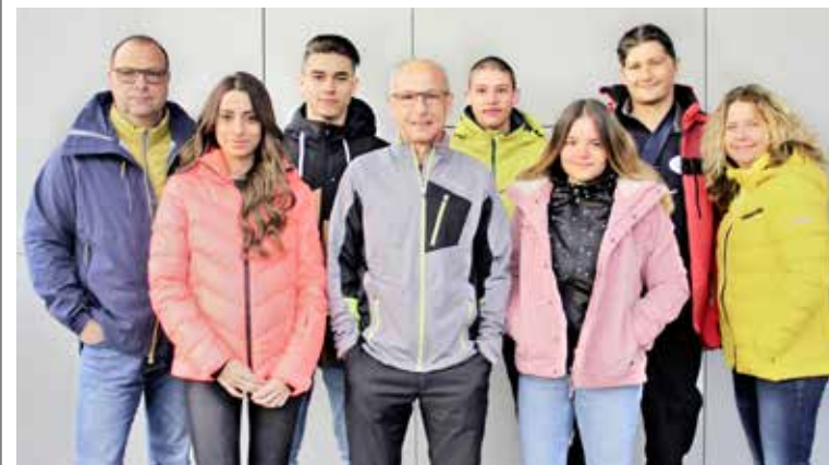
Sportlich und modisch eingekleidet durch den Herbst und Winter. Das Team von Paddy Sport hat eingekauft und präsentiert viele Neuheiten.

Morgen Samstag, 26. Oktober, lädt Paddy Sport an der Salwiesenstrasse 10 in Arbon mit Marroni und Punsch sowie einem grossen Schnäppchenzelt zur Wintereröffnung. Zu Gast ist das Team der Marke «Stielvoll».