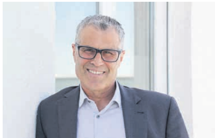
Der SRF Fussballexperte und 80-fache Schweizer Nationalspieler Andy Egli gibt im KYBUN JOYA Gesundheitscenter in Arbon seine Gesundheitstipps weiter.

Seine Erfahrung gibt der Arthrose-Patient im KYBUN JOYA Gesundheitscenter in Arbon nun Leidgenossen in individuellen Beratungen weiter.