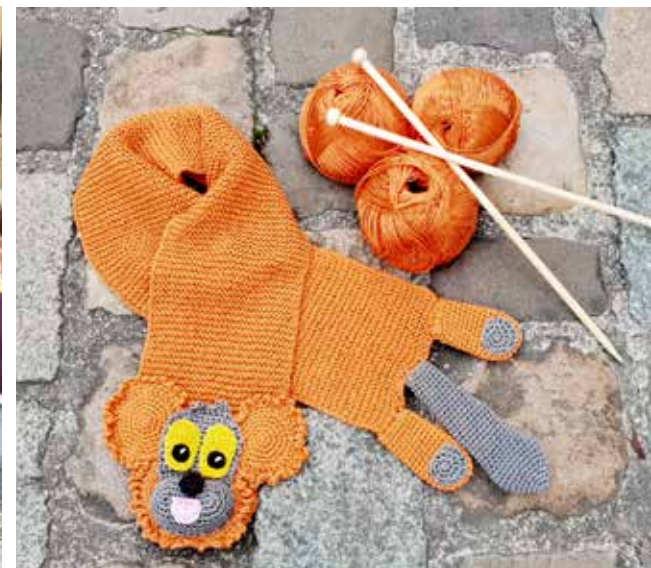
Das Schweizer Grosshandelsunternehmen Coop lässt bei «Filati» in Arbon «JaMaDu»-Kinderschals stricken.