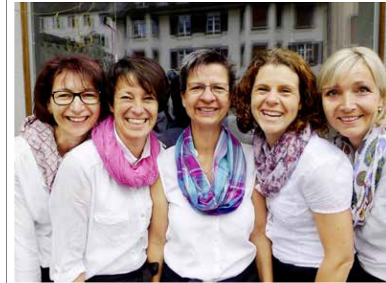
Das «Natürli»-Team berät und bedient die Kundschaft persönlich und kompetent.

Das «Natürli» in der Arboner Altstadt bietet ein erstklassiges, auserlesenes Weinsortiment. Am Freitag, 1. November, von 14 bis 19 Uhr und am Samstag und Sonntag von 14 bis 17 Uhr lädt das «Natürli» zur alljährlichen Weindegustation mit zehn Prozent Rabatt ein.