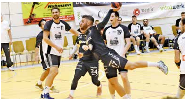
Kann sich das Herren 1 des HC Arbon gegen Pfader Neuhausen durchsetzen?

Von den 14 Juniorenmannschaften spielen zurzeit vier Teams in der Inter-Klasse. Die MU15 Inter und MU17 Inter kämpfen dabei am Samstag zu Hause um wichtige Punkte für den Klassenerhalt. Beide Teams haben aktuell vier Punkte erreicht und liegen im Tabellenmittelfeld. Mit dem Tabellenleader Red Dragons Uster (MU15I) und dem Tabellenzweiten SC Frauenfeld (MU17I) warten morgen starke Gäste-teams auf die HCA-Junioren. Das Herren 1 tritt dann um 17 Uhr gegen den punktgleichen Gegner Pfader Neuhausen an. Nachdem der