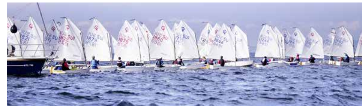
Dieses eindrückliche Bild präsentierte sich am Wochenende vor Arbon – als die Optimisten-Segler regattierten.

Am Wochenende segelten die Optimisten vor Arbon. Der Yachtclub Arbon organisierte sowohl die Punktmeisterschaft als auch die Bodenseemeisterschaft in der Optimisten-Klasse.