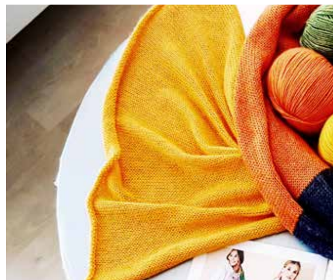
Das weltweit erscheinende Strickheft bildet regelmässig Modelle von «Filati Mode mit Wolle» ab.