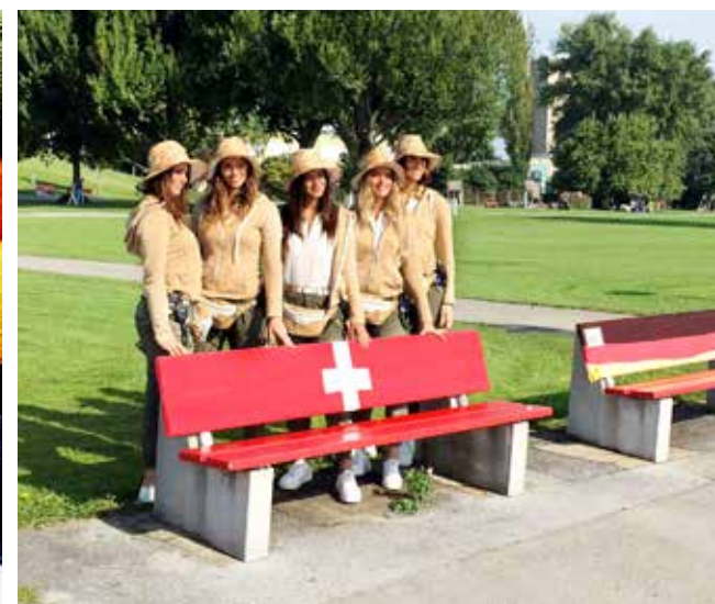
Der italienische TV-Sender «Rete 4» filmte den Strickweg und wird darüber berichten am 20. Januar 2020.