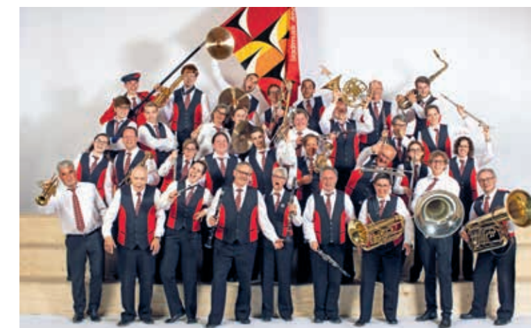
Vielseitig präsentiert sich die Stadtmusik Arbon an ihren Unterhaltungskonzerten dieses Wochenende im Seeparksaal.

Die diesjährigen Konzerte der Stadtmusik Arbon versprechen ein attraktives Menü mit abwechslungsreichen Melodien. Von einer japanischen Vorspeise über Knödel oder eine Berner-Platte bis zur Eiscreme ist für jeden Geschmack etwas dabei.