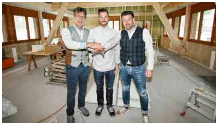
Sie spannen zusammen und eröffnen am Standort von «Medfit» und «Kybun» das Gesundheitszentrum «Vitalwerk» – für Menschen mit Beschwerden.

Im Dorfzentrum von Roggwil eröffnet am 8. Februar ein neuartiges Zentrum für Gesundheit: Das «Vitalwerk» bietet individuelle Gesundheitstrainings an, die speziell auf Menschen mit Beschwerden zugeschnitten sind.