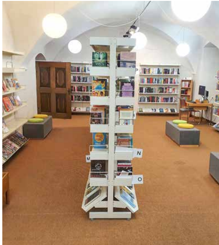
Blick in die Stadtbibliothek Arbon im Haus zur Straussfeder in der Altstadt.

2021 war auch für die Stadtbibliothek Arbon ein aussergewöhnliches Jahr. Es gab mehrere Tage mit geschlossenen Türen, jedoch hat das Bibliotheks-Team diese Gelegenheit genutzt, um einige Neuerungen und Verbesserungen einzuführen.