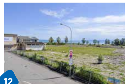
Booster fürs Bücherparadies