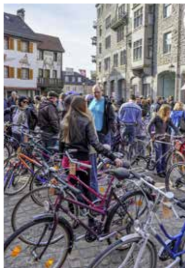
Arbon – auf dem Weg zur Velostadt.

Auf die Velobremse steht der Stadtrat in Sachen «Rechtsabbiegen bei Rot». Dies sei aus gesetzlichen Gründen noch nicht umsetzbar bei den von den Interpellant(inn)en genannten Lichtsignalen. Auch für den langen Kreisel beim Rosengarten und entlang der NLK liegt noch keine velofreundliche Lösung auf der Strasse. Hier könne die Stadt mögliche Verbesserungen nicht selbst realisieren, da es sich um eine Kantonsstrasse handle, stellte Stadtpräsident Dominik Diezi klar. «Als die NLK gebaut wurde, stand das Velo nicht im Vordergrund – sonst hätten wir einige Probleme weniger», sagt Diezi unverblümt. Die Probleme seien jedoch erkannt und die