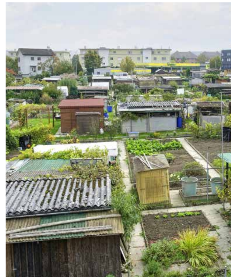
Ein neues Schulzentrum statt Schrebergärten: Die Sekundarschulgemeinde Arbon würde gerne auf der Parzelle gegenüber der Laveba-Tankstelle an der St. Gallerstrasse bauen. kim

Anstieg der Schülerzahlen Gemäss den Prognosen werden die Schülerzahlen von heute circa 590 bis in 10 Jahren auf circa 700 ansteigen. Diese Zahl basiert auf den heutigen Schülerzahlen der vorgelegten Schulen sowie den Geburten per August 2023. Nicht eingerechnet sind darin also die Zuzüge von Schülerinnen und Schülern, welche aufgrund der nach wie vor bedeutenden Bautätigkeit im Einzugsgebiet der SSGA erheblich sein werden. Gemäss heutiger Rechnung wird sich die Anzahl der zu führenden Klassen von jetzt 34 ab dem Schuljahr 2024 auf 37 und ab 2025 auf 38 erhöhen. Für 2029 ist ein Anstieg auf 40 Klassen prognostiziert. Bewältigt werden wird dieses Mehr vorerst durch den zusätzlich