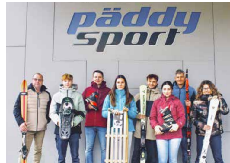
Das Team von «Paddy Sport» ist bereit für die Wintersaison. z.V.g.

Traditionellerweise beginnt die kalte Jahreszeit bei «Paddy Sport» mit der Wintereröffnung. Kundinnen und Kunden dürfen sich an diesem Tag von 8.30 bis 17 Uhr an der Salwiesenstrasse 10 in Arbon bei Marroni, Punsch und Kaffee einen Überblick über die aktuellen Wintertrends verschaffen. Und natürlich wird auch das grosse «Schnäplizelt» mit Rabatten von 50 bis 70 Prozent nicht fehlen. Auf das reguläre Sortiment gibt es zudem einen Spezialrabatt von 20 Prozent (ausgenommen Wintermietartikel, Nettopreise, Gutscheine und Serviceleistungen) und für jedes gemietete Snowboard oder Paar Ski gratis Rohner-Skisocken. Nebst den passenden Sportgeräten für den Winter führt «Paddy Sport» auch ein breites Textilsortiment, in dem neben den bekannten