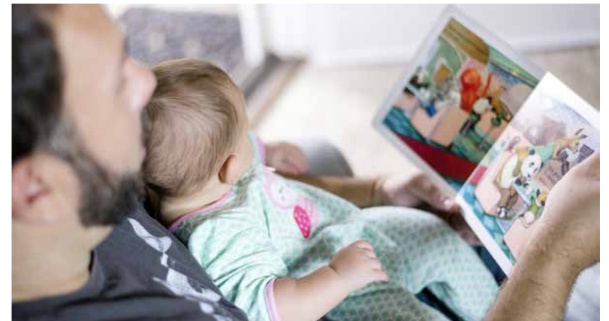
Die Mütter- und Väterberatung der Perspektive Thurgau steht Eltern von Säuglingen bis Kleinkindern von fünf Jahren kostenlos zur Verfügung.

Für die Familie sind Hausbesuche super, da die Anreise zum Beratungsort entfällt. Insbesondere wenn eine Familie mehrere Kinder hat, ist es für die Eltern leichter, wenn sie diese in ihrer gewohnten Umgebung spielen lassen können, während sie sich mit einer unserer Beraterinnen unterhalten. Für uns wiederum hat ein Hausbesuch den Vorteil, dass wir einen konkreten Einblick ins Familiensystem erhalten. Gewisse Herausforderungen sind zuhause viel deutlicher sichtbar, so dass wir die Familien bedürfnis- und lösungsorientiert beraten und gezielt fördern können.