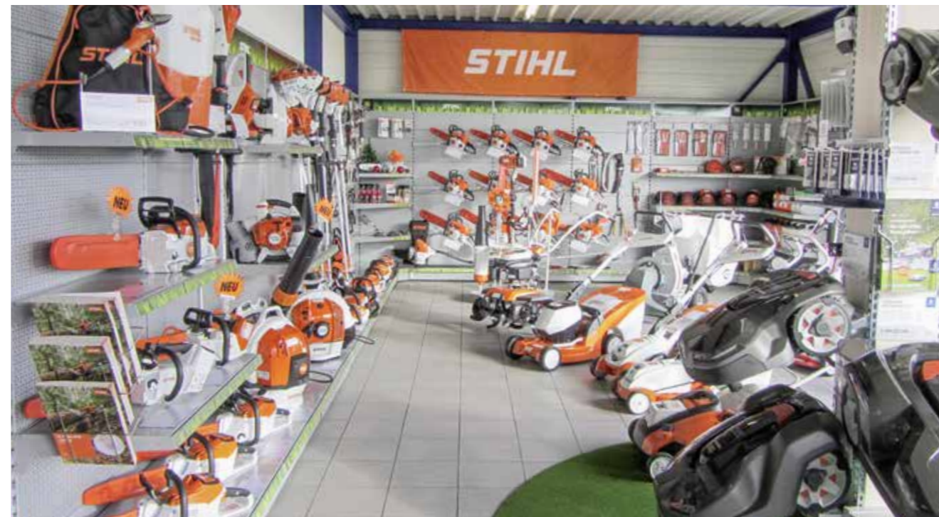
Die Forrer Landtechnik AG in Frasnacht verfügt über ein umfangreiches Sortiment an «Stihl»-Produkten für Aussenarbeiten.

Nein, es braucht einfach das passende Ladegerät zum Akku. Wir verkaufen auch Schnellladegeräte, welche eine kürzere Ladezeit benötigen.