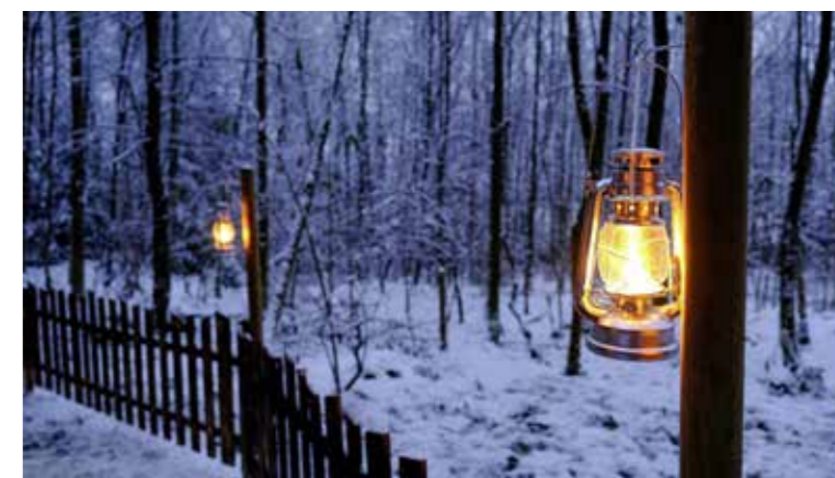
Die Laternen weisen den Weg durch den verwunschenen Wald. kim

GANZE DREI TAGE LANG KÖNNEN DIESES JAHR DIE VERWUNSCHENEN MOTIVE ENTLANG DES «LATERNLIWEGS» ERKUNDET WERDEN. DIE DRITTE DURCHFÜHRUNG DES VORWEIHNACHTLICHEN ANLASSES DAUERT NÄMLICH EINEN TAG LÄNGER ALS BISHER. VON HEUTE FREITAG, 15. DEZEMBER, BIS SONNTAG, 17. DEZEMBER, JEWEILS VON 17 BIS 21.30 UHR FÜHRT DER 1,6 KILOMETER LANGE SPAZIERGANG MIT STARTPUNKT BEIM SCHÜTZENHAUS TÄLISBERG DURCH DEN GLEICHNAMIGEN WALD. WEGEN DER STURM- UND SCHNEESCHÄDEN DIESMAL JEDOCH NICHT ALS RUNDWEG, SONDERN BIS ZUR KRIPPE UND ZURÜCK. DIE NEUE WEGFÜHRUNG TUT DEM WEIHNACHTLICHEN ZAUBER JEDOCH KEINEN ABBRUCH. ES GIBT AUCH DIESMAL DIVERSE ÜBERRASCHUNGEN ZU ENTDECKEN. UND AUCH SONST HÄLT DER ANLASS EINIGES BEREIT: HEUTE FREITAG UM CIRCA 18 UHR BESPIELEN DIE «WANNABES» AUS ARBON