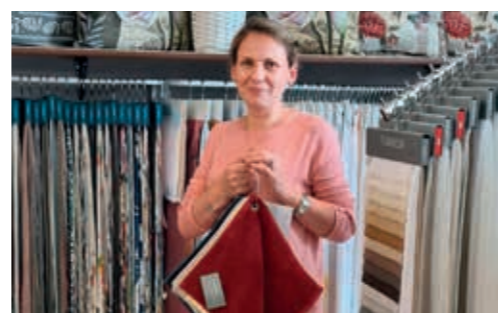
«Iliazis-Nähservice» offeriert zehn Prozent Rabatt.