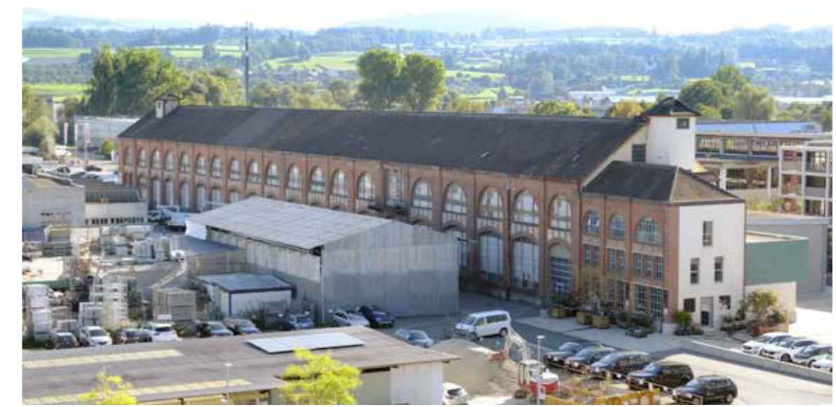
In der Webmaschinenhalle auf dem WerkZwei-Areal in Arbon kommt Ende 2024 die Kunstausstellung Heimspiel unter. kim