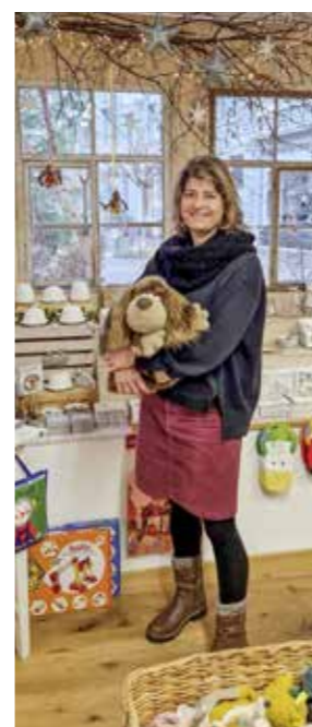
Freude schenken für Gross und Klein (links). Edelsteine, Kerzen und vieles mehr bei Rosenquarz.