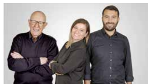
Aktion Familienshooting bei «Foto Alpha».