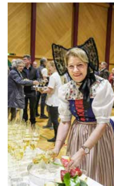
Die Trachtenfrauen sind traditionsgemäss an der Neujahrsbegrüssung der Stadt Arbon anzutreffen.