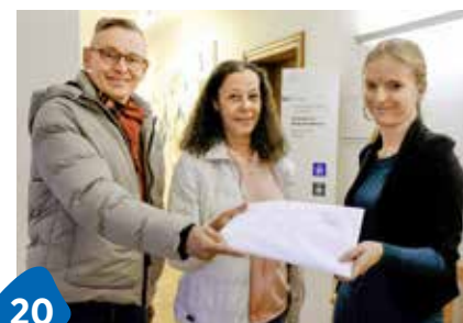
Dicke Luft ums Farinoli-Haus