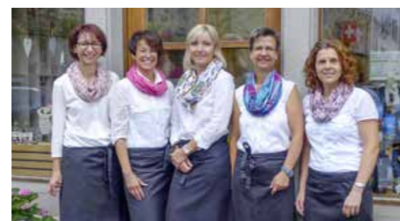
«Natürli» – feine Spezialitäten schön verpackt.

Auch ein Gutschein vom Gewerbe Thurgau oberer Bodensee (GTOB), der am Schalter der Kantonalbank in Arbon gekauft werden kann und in über 70 Geschäften und Firmen einlösbar ist, ist ein schönes Weihnachtsgeschenk. Mehr Informationen dazu sind auf der Homepage gtoeb.ch/gutscheine zu finden.