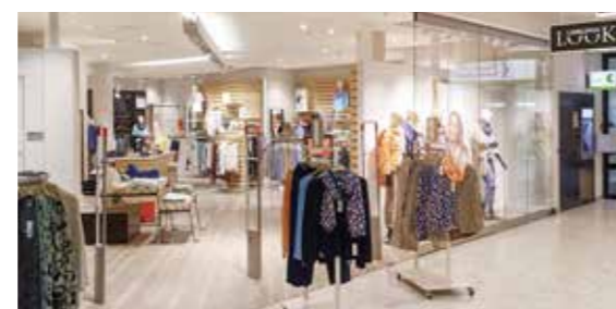
«Lieblingslook» öffnet am Sonntag von 12 bis 17 Uhr die Türen.