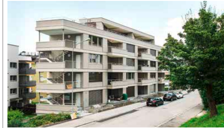
Der fünfstöckige Leichtbau an der Röschstrasse in St. Gallen ist innen wie aussen in Holz gehalten.

Bei der Kaufmann Oberholzer AG herrscht Freude. Die Herstellerin von Holzelementbauten erhielt für die Aufstockung eines Wohnhauses in St. Gallen den «Prix Lignum 2018» der Region Ost.