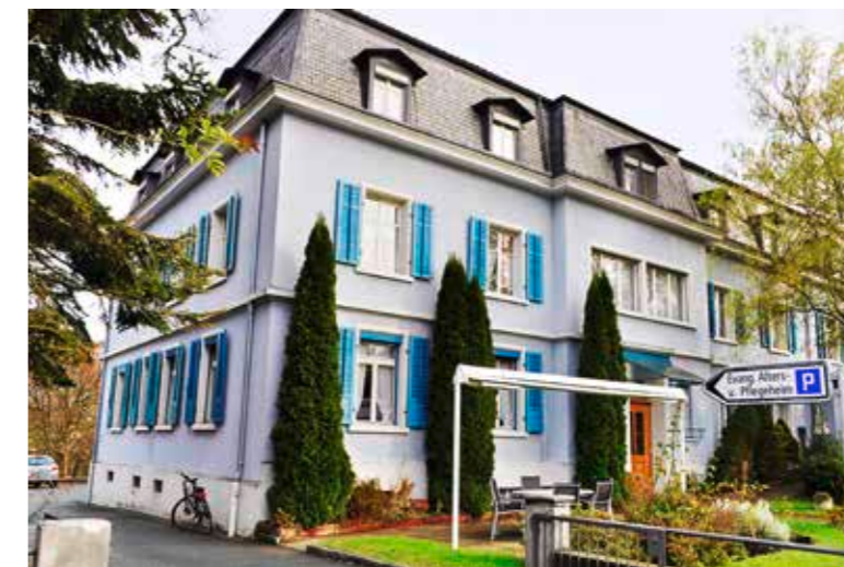
Die Liegenschaft des ehemaligen evang. Altersheims an der Romanshornstrasse 44 in Arbon.

Die Vorsteherschaft der Evangelischen Kirchgemeinde Arbon beabsichtigt, das Areal Romanshornstrasse 44 mit dem ehemaligen Alters- und Pflegeheim und 7445 Quadratmeter Land im Baurecht abzugeben . Der Entscheid über die Abgabe obliegt der Kirchgemeindeversammlung und dem Kirchenrat der Evang. Landeskirche Thurgau .