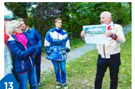
Speed Dating für Singles