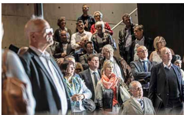
Gespannt lauscht die versammelte Prominenz – darunter Thurgauer Nationalrätinnen und -räte sowie der Olma-Direktor – den launigen Reden.

Nicht nur die möhlschen Obstsilos in Stachen erleben derzeit eine grosse Fülle. Auch das Publikumsinteresse für das «bäumige» Möhl-Museum namens «MoMö» ist enorm. Am Wochenende war das Museum erstmals fürs Publikum offen – und prompt kauften sich jeweils zwischen 800 und 900 Personen eine Eintrittskarte. Viel Anerkennung und Lob ertneten die Familien Möhl auch von Seiten der geladenen Gäste bei der Einweihung. Viel Prominenz aus Gewerbe, Wirtschaft und Politik war angereist und war sich einig: «Das Museum ist eine Perle für Arbon und den Kanton»