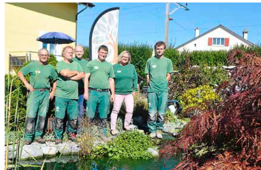
Umgebungsarbeiten für ein Einfamilienhaus in Steinach (links) – das Team von Ribi Gartenbau (rechts) ist kompetenter Gartenpartner bei Bau und Umgestaltung von privaten Ruheoasen.