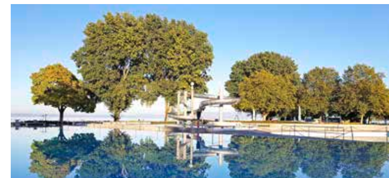
Das Schwimmbad wird fürs Winterhalbjahr vorbereitet.

Rund 25 000 Besucherinnen und Besucher fanden 2018 den Weg ins Strandbad. Auch hier konnte die