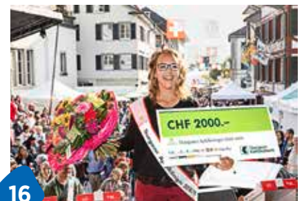
Zeit für die Gartenprofis