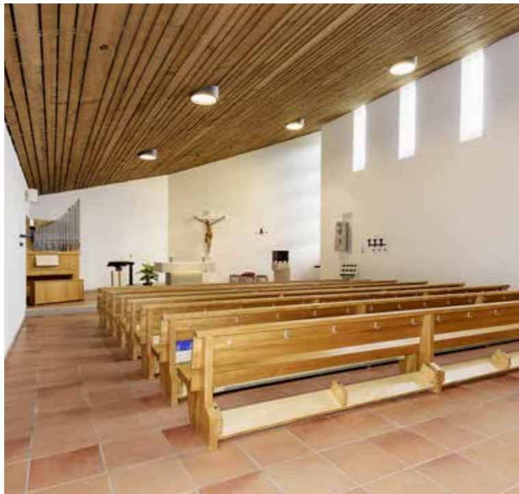
Der Innenraum der Otmarskirche: Die Architektur lehnt sich an die revolutionäre Kirchenarchitektur von Le Corbusier in der Kapelle Notre Dame-du-Haut im französischen Ort Ronchamp.

55 Jahre nach der Erbauung hat die Otmarskirche nichts von ihrem ästhetischen Reiz eingebüsst. Gerade in unseren Tagen kommen die architektonischen Qualitäten des Kleinods voll zum Tragen. Aber der Zahn der Zeit hat an der Kirche genagt. Eine Totalsanierung war überfällig. Der schon fast ungläubliche Schmutz, der sich in den letzten gut 50 Jahren an den Wänden abgelagert hat, ist entfernt worden. Dank rundum erneuerter Beleuchtung können wir die Kirche zudem im wahrsten Sinne