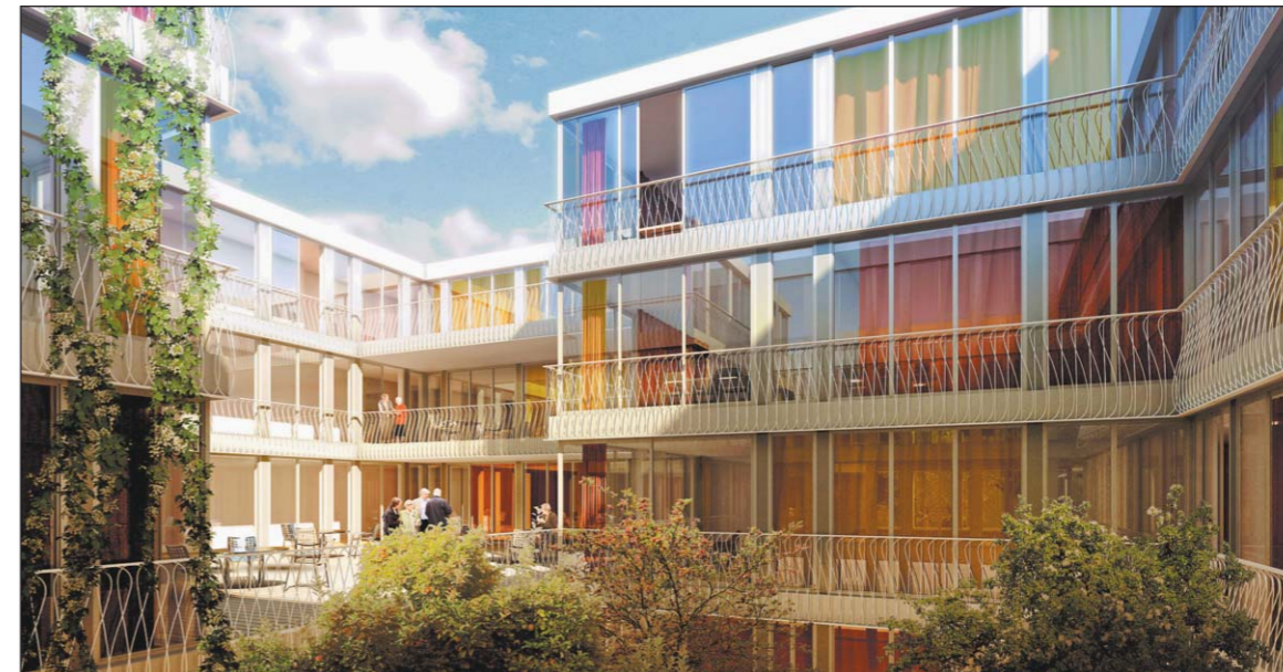
Visualisierung der Zürcher Architekten Allemann Bauer Eigenmann – Innenhof mit Terrasse der Demenzstation.

Zehn Jahre nach dem ersten Erweiterungsbauprojekt hat die Genossenschaft Sonnhalden wiederum Geschichtsträchtiges vor. Das Projekt «Sonnhalden plus» mit 40 Pflege- und 20 Demenzbetten soll ab Sommer 2015 realisiert werden und rund 18 Mio. Franken kosten.