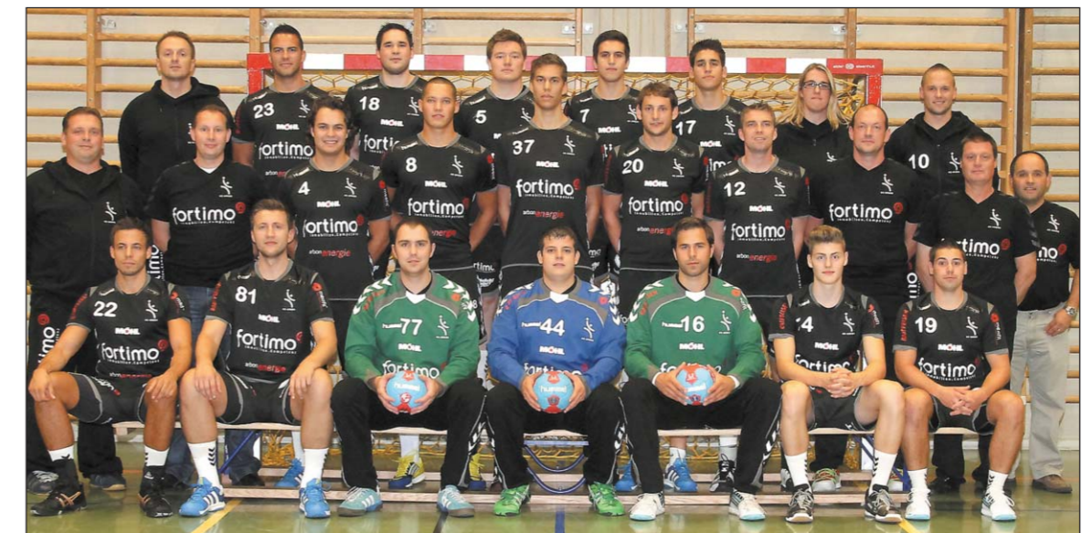
Die 1.-Liga-Herren streben einen Platz im vorderen Tabellenbereich an.

Gleich mit vier Mannschaften ist der Handballclub Arbon in der bevorstehenden Saison in interregionalen Ligen vertreten. Neben den Herren und Damen in der 1. Liga, versuchen sich auch die U19- und die U15-Junioren in der Inter-Klasse unter den besten Mannschaften der Schweiz zu behaupten.