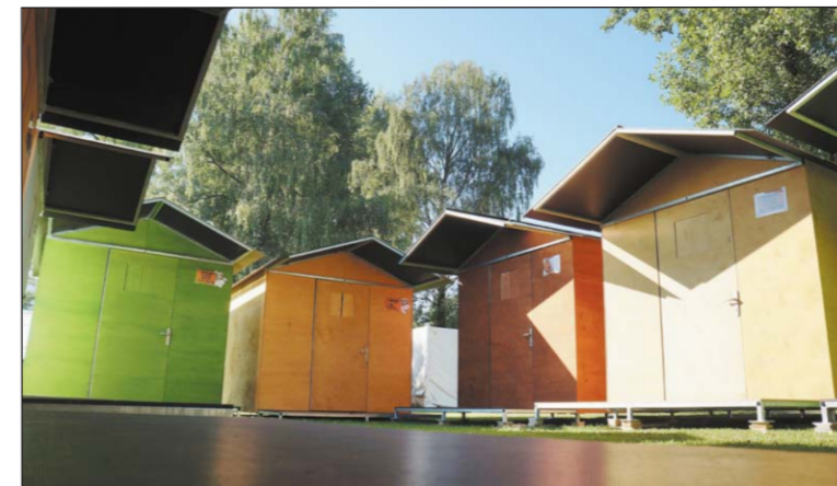
Das einzigartige Festivalhaus wurde von Glovital AG entwickelt.

Die Firma Glovital AG steht seit 30 Jahren für Qualität im Bereich Holzbauten für Haus, Hof und Garten, sowie deren Schutz und Erhalt. Highlight in diesem Jahr ist das weltweit einzigartige Festivalhaus, welches die Schweizer Firma Glovital AG entwickelte.