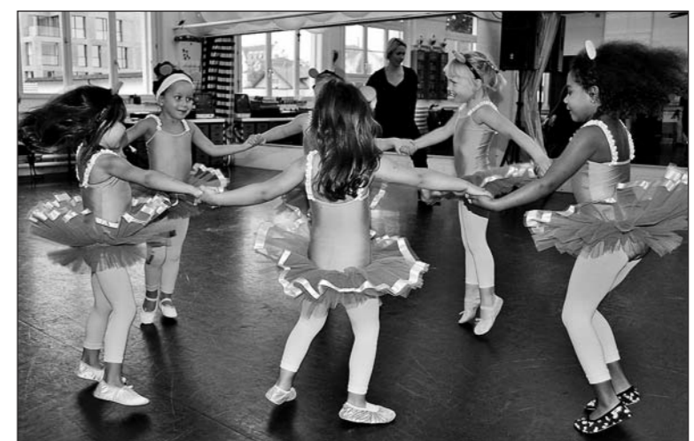
«Tanzhotel» – eine Benefizgala zum Zehn-Jahr-Jubiläum der Tanzwerkstatt.

Wenn sich am Wochenende rund 400 Akteure der Arboner Tanzwerkstatt im «Tanzhotel» treffen, dann dürfen sich darüber auch kranke Kinder freuen. Der gesamte Erlös fliesst nämlich in die Kasse der Kinderspitex Ostschweiz (siehe Box).