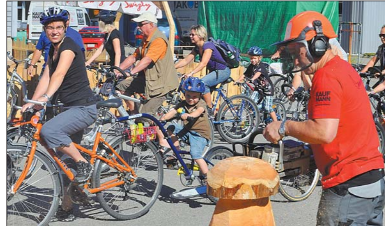
40-Jahr-Jubiläum der Kaufmann Oberholzer AG mit Attraktionen.