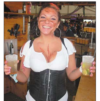
Charmante Seeräuberin aus dem «Pirates» St.Margrethen.

Trotz riesiger Temperaturunterschiede – die Werte schwankten zwischen 35 und 15 Grad – ging das «SummerDays» am Arboner Seeufer bei ungebrochener guter Stimmung mehrheitlich trocken und vor allem am Freitagabend ohne die befürchteten Sturmböen über die Bühne. Mit 23 000 Besuchern war das Festival beinahe ausverkauft und sorgte bei den Organisatoren sowie den verschiedensten Zelt- und Standbetreibern auch aus finanzieller Sicht für zufriedene Gesichter. Nicht nur auf, sondern auch neben der Bühne liess das Oberthurgauer Openair-Highlight kaum Wünsche offen. Überzeugen konnten sowohl die perfekte Infrastruktur als auch das bewährte Konzept mit den Oldies am Freitag, dem Schweizer Mix mit Zugabe am Samstag sowie mit dem Gratis-Familienangebot am Sonntag.