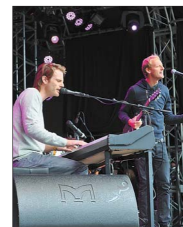
Heimvorteil für «Junes» – die vielversprechende St.Galler Band.