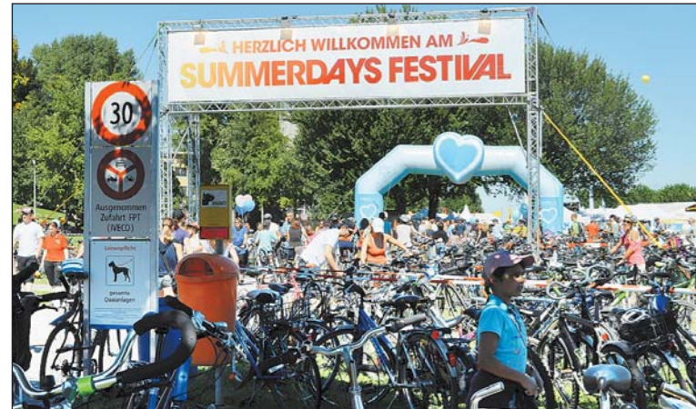
«slowUp» und «SummerDays» – eine perfekte Symbiose.