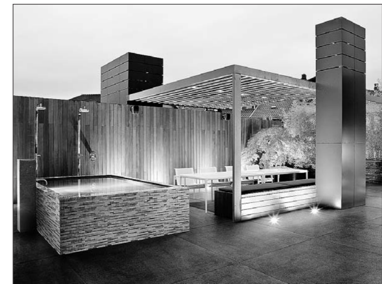
Casa dolce Casa.

Am Samstag und Sonntag, 3./4. September, von 10.00 bis 17.00 Uhr öffnet das Fachgeschäft «hama keramikdesign GmbH» an der St. Gallenstrasse 115 in Arbon seine Türen.