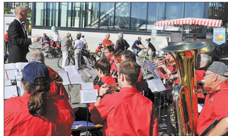
Besinnliche Klänge der Stadtmusik Arbon am Gottesdienst bei Möhl.