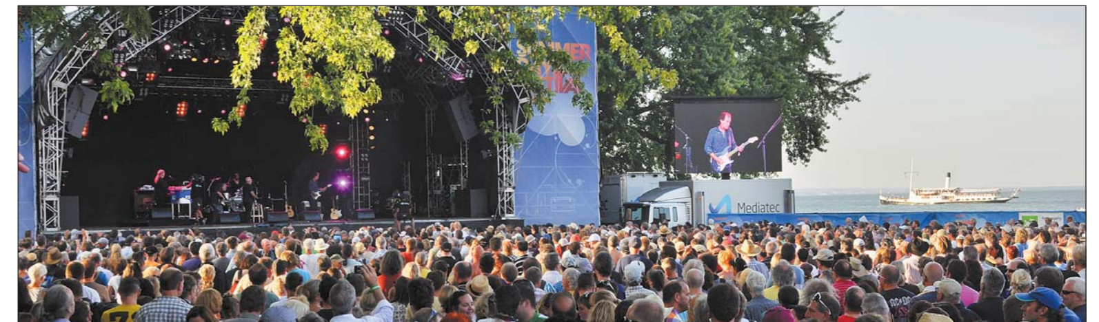
Einzigtages «SummerDays»-Festival – ein solch faszinierendes Ambiente ist nur auf den Arboner Parkanlagen am Bodensee möglich.