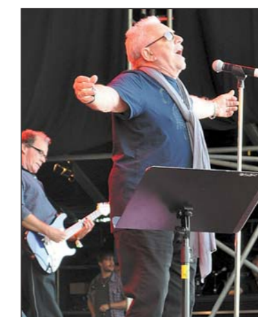
Eric Burdon & The Animals – britischer Rock der alten Schule.