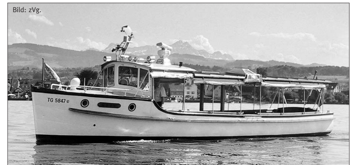
Das Motorschiff Mars – 1922 in der Erhartswerft in Berlin-Spandau als Kurs- und Ausflugsschiff erbaut.

Abbruch oder Sanierung lautete die Frage nach der Ausmusterung des MS Mars im Jahr 1990. Glücklicherweise hatte eine Handvoll Idealisten etwas gegen die Verschrottung dieser bald 90-jährigen Schönheit!