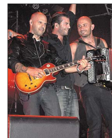
Für viele der absolute Höhepunkt – Mundart-Rapper Bligg.