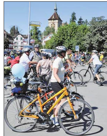
Halten und geniessen: mit entschleunigter Mobilität unterwegs.