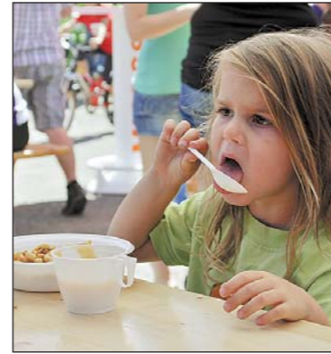
Ghackets und Hörnli als Stärkung für die Weiterfahrt...