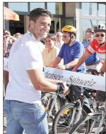
Start mit dem amtierenden Mister Schweiz, Luca Ruch.