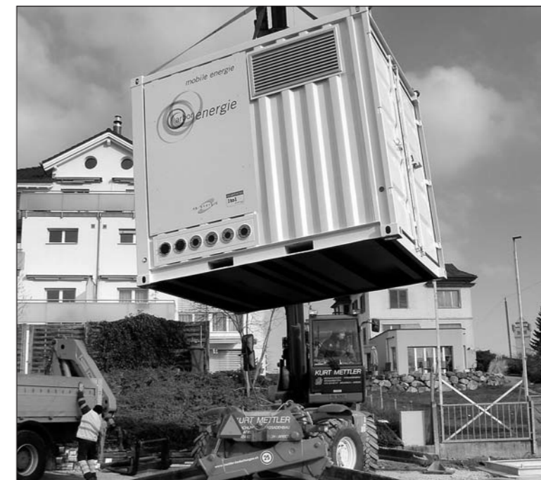
Im Einsatz für die Strombezüger: Mitarbeiter der Arbon Energie installieren in der Überbauung Rosengarten eine provisorische Trafostation.

Die Arbon Energie AG sorgt seit 1886 für Wasser und seit 1922 für elektrische Energie in Arbon. Die sichere und wirtschaftliche Stromversorgung und die Versorgung mit einwandfreiem Trinkwasser für die zahlreichen Unternehmen und über 13 000 Einwohnerinnen und Einwohnern ist ihre zentrale Aufgabe. Dafür betreibt, baut und unterhält Arbon Energie AG ein Wasserleitungsnetz von rund 122 Kilometern und ein Energienetz von rund 203 Kilometern Länge mit verschiedenen komplexen Anlagen. Für die Strombeschaffung hat sich Arbon Energie AG als fünfter Aktionärspartner an der SN Energie AG beteiligt. Seit 40 Jahren liefert das eigene Seewasserwerk einwandfreies Trinkwasser. Arbon Energie AG ist an der Regionalen Wasserversorgung St.Gallen beteiligt und betreibt zusammen mit elf weiteren Partnern ein sicheres und effizientes Versorgungssystem. red.