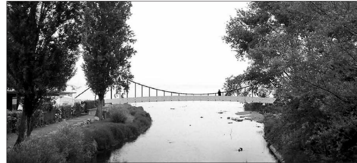
Die neue Brücke kostet den Steinacher Steuerzahler 102 000 Franken und soll in zehn Jahren amortisiert werden.

Die Steinacher Stimmberechtigten haben anlässlich der Bürgerversammlung vom 24. März dem Kreditbegehren über 291 000 Franken für den Neubau einer Fussgängerbrücke bei der Steinachmündung zugestimmt. Auf Grund der bisherigen Vorbereitungsarbeiten mit Planaufgabe und Einleitung der Bewilligungsverfahren konnte bereits