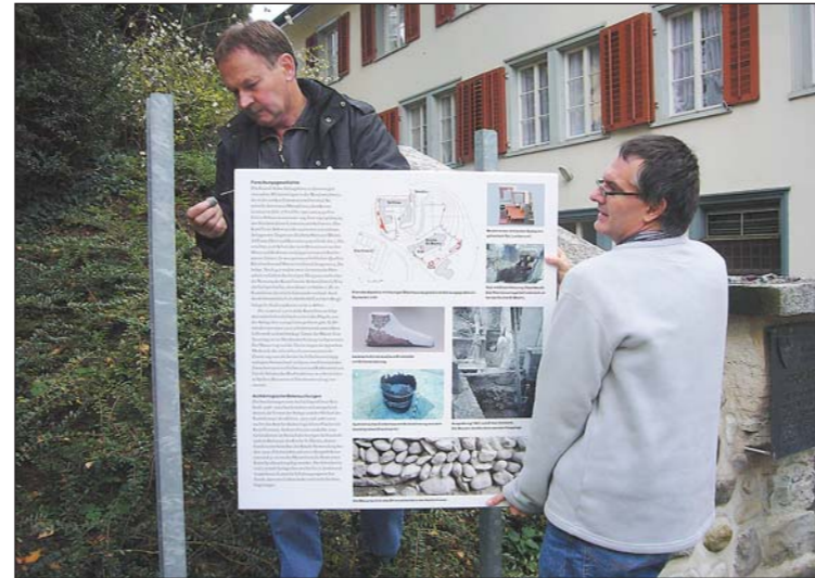
Mitarbeiter des Archäologieamtes installieren die neue Tafel.

Die Erforschung der Arboner Geschichte bringt immer wieder neue Erkenntnisse. Aufgrund aktueller Grabungen haben Fachleute des Amtes für Archäologie des Kantons Thurgau beim freigelegten spätrömischen Wachturm an der Hafenstrasse eine neue Informationstafel installiert. Aussagekräftige Farbbilder ergänzen nun den aktualisierten Text über das Kastell «Arbor Felix». Die abgebildeten Objekte sind – wenige Schritte entfernt – im Historischen Museum Schloss Arbon