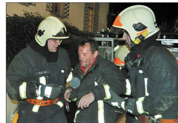
Nach der Bergung mit der Autodrehleiter wird ein «Opfer» fachkundig betreut und medizinisch versorgt.