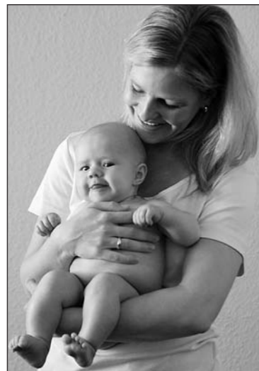
Liebevoll trägt die Mutter ihr Baby auf dem Unterarm.

Freitagmorgen kurz vor halb zehn Uhr: fröhlich trudeln Mütter mit ihren Kindern mit dem Auto oder Kinderwagen in Roggwil an der Obstgartenstrasse 20 ein. Hier stellt sich nur noch die Frage: Kommen diese Mütter zur Babymassage oder zum PEKiP-Kurs?