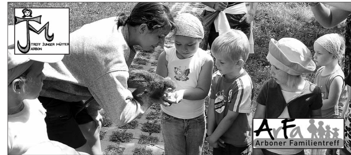
Wie beim «Treff junger Mütter» werden auch die Aktivitäten im «Arboner Familientreff» vielfältig sein.

Egal, welche Religion, welches Geschlecht oder welches Alter – beim «Arboner Familientreff» sind als Begleiter von Kleinkindern bis zum Unterstufenalter alle willkommen. Deshalb wurde aus dem ehemaligen «Treff junger Mütter (TJM)» der «Arboner Familientreff (ArFa)».