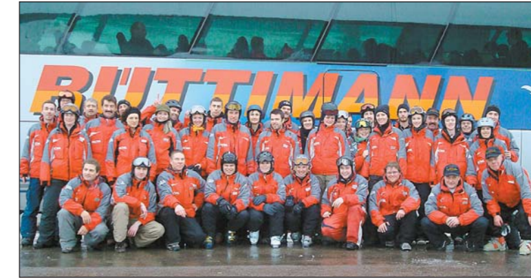
Rund 50 Leiterinnen und Leiter unterrichten an den KTV-Schneesportkursen.

Bereits zum 53. Mal finden in dieser Saison die traditionellen Schneesportkurse des KTV Arbon für den Ski- und Snowboardnachwuchs in Wildhaus statt.