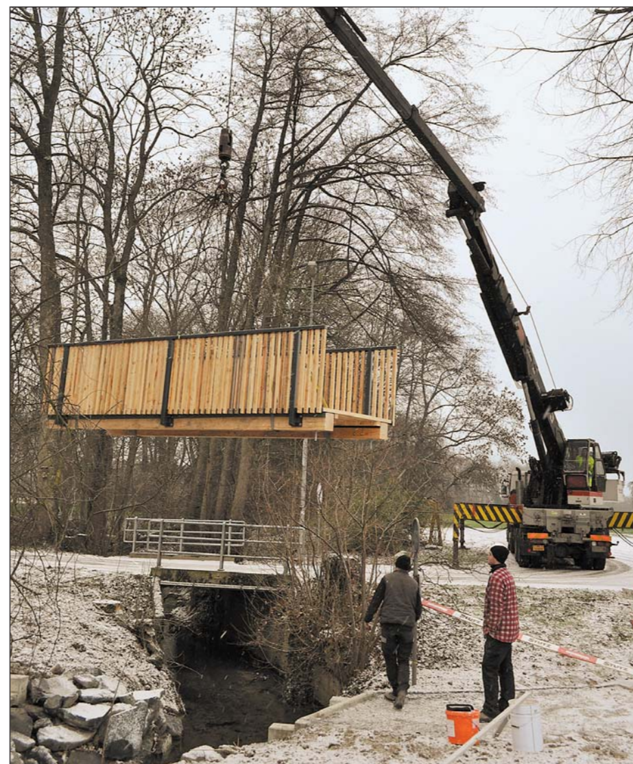
Massarbeit von Achilles Fecker Holzbau: Die Brücke über den Imbersbach ist 5,5 Meter lang, 1,4 Meter breit und kostet weniger als 10 000 Franken. Die Holzkonstruktion und der Gehbelag sind aus Lerche, das Geländer ist stahlfeuert verzinkt und einbrennlackiert mit Lerchen-Geländerlatten. Für die Endmontage wurde ein Pneukran aufgeboten.

Stahl (500-600kWh), der mit Abstand sparsamste und nachhaltigste Baustoff im Konstruktionsbau überhaupt. Ein weiterer Vorteil ist laut Achilles Fecker die bis auf wenige Millimeter genaue Elementbauweise mit dem von Natur aus erdbebensicheren Baustoff Holz.