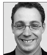
Von Jörg Freundt Messepräsident