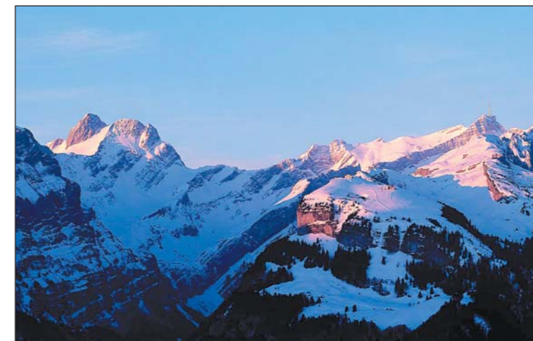
Altmann, Ebenalp, Säntis