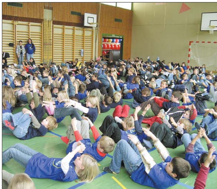
In Bewegung sein – mindestens 60 Minuten pro Tag – wurde gleich mit einfachen Übungen ausprobiert. Wenn die Steinacher Kinder bis zum 20. Dezember durchhalten, erhalten sie für ihren Einsatz eine Auszeichnung.