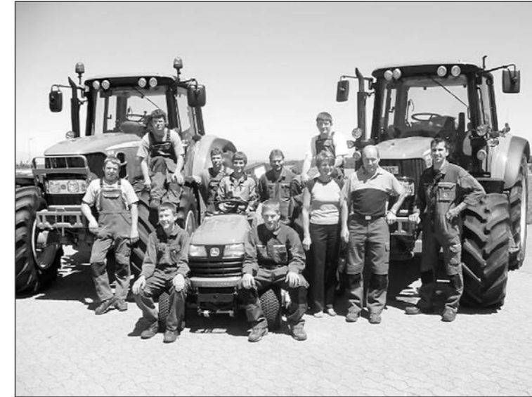
Das Team der Forrer Landtechnik AG lädt zum 20-Jahr-Jubiläum ein.

Der kompetente Partner für Traktoren, Fahrzeuge, Maschinen, Rasen- und Motorgeräte feiert Geburtstag! Forrer Landtechnik AG im Frasnachter Bühlfhof lädt am kommenden Wochenende zum 20-Jahr-Jubiläum mit verschiedenen Highlights ein.