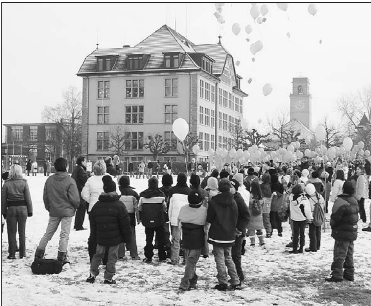
Am 3. Januar wurde das Jubiläumsjahr zum 100. Geburtstag des Berglischulhauses mit einem Ballonflug-Wettbewerb eröffnet.

Mit einem umfangreichen Fest wird morgen Samstag der 100. Geburts-