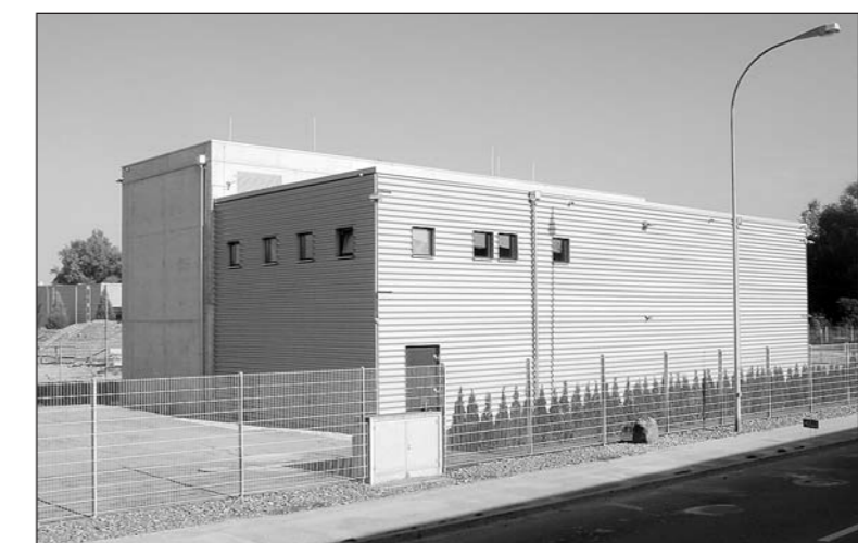
Die Bauarbeiten für das Leitungsnetz und die Transformatoranlage Salwiese in Arbon sind abgeschlossen und die Anlagen in Betrieb.

Mit der Fertigstellung der neuen, unterirdischen Stromversorgungsleitung hat SN Energie zwei Ziele erreicht: Zum einen den Anschluss des EW Romanshorn an das Netz der SN Energie, und zum anderen eine höhere Versorgungssicherheit für Arbon als Aktionärspartner.