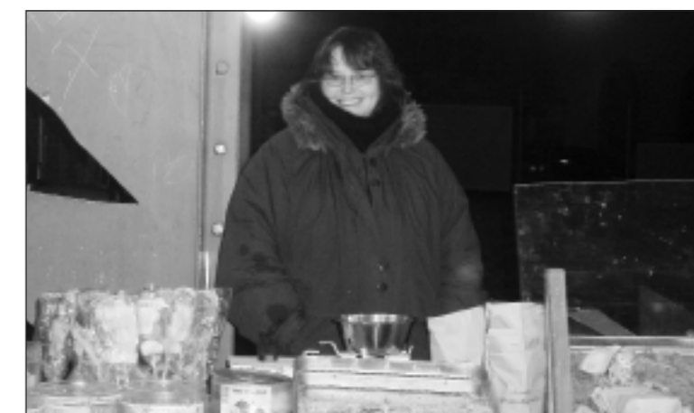
Outdoor – frostig-einsames Warten auf Arwa-Kunden.