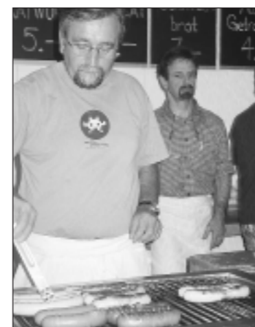
Roll-Möps – Garant für gute Würste.