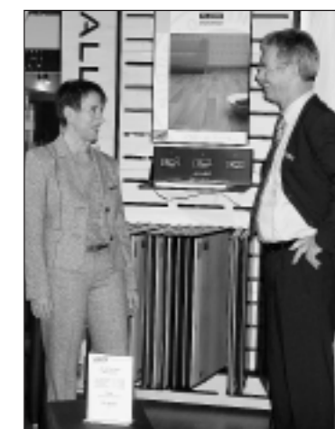
Möbel Feger – zufriedene Aussteller.