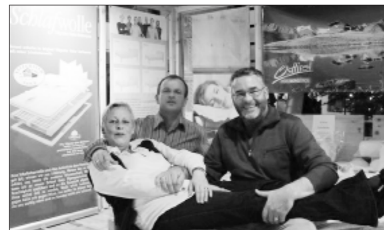
Osttirol – sympathische Vertretung mit hervorragenden Produkten.