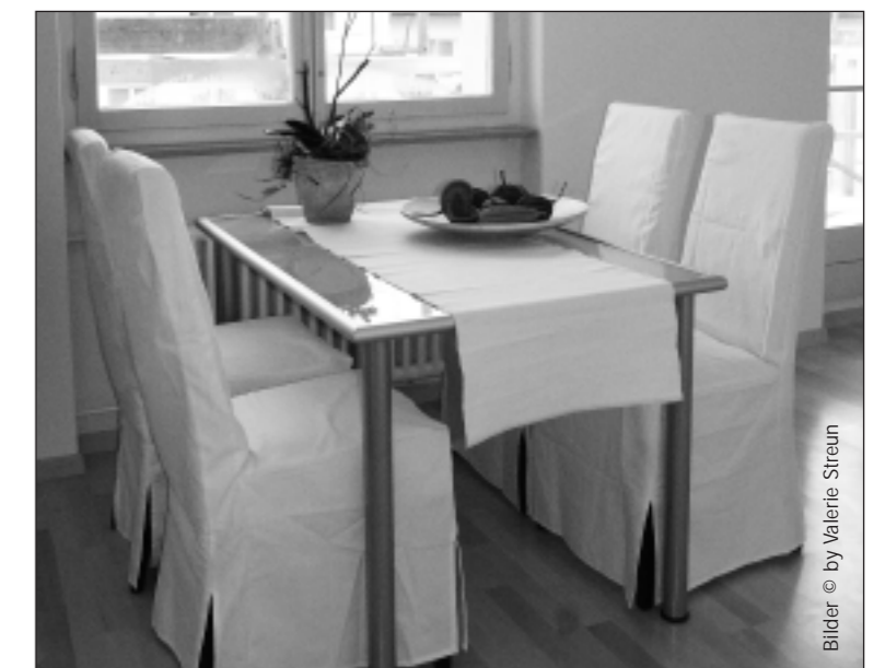
Das geräumige Esszimmer.