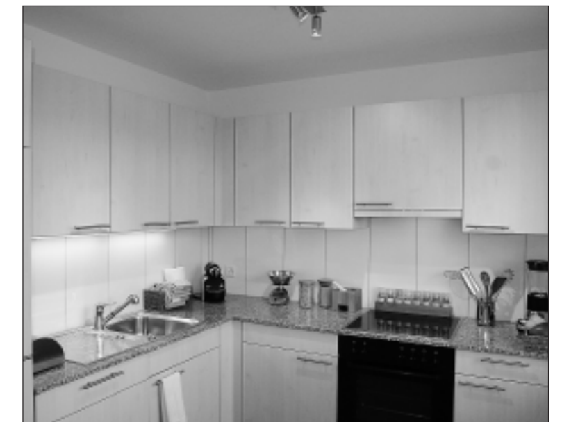
Die Küche mit Granitabdeckung.

Die Wohnungen erstrahlen in neuem Glanz. So schaffen Parkettböden in den Wohn- und Schlafräumen eine behagliche Atmosphäre, die Küche und das Bad verfügen über Keramikplatten als Bodenbeläge. Alle Küchen verfügen neu über eine Granitabdeckung und einen Geschirrspüler. Die modernen Bäder verfügen alle über Bad/WC. Die Balkone sind ebenfalls erneuert worden und erweitern den Wohnraum mit einem gedeckten Aussenraum. Der Mietpreis für eine Zweieinhalb-Zimmer-Wohnung beträgt ab 725 Franken im Monat, der Mietpreis für eine Vier-Zimmer-Wohnung ab 965 Franken. Die modern ausgebauten Wohnungen sind ab sofort bezugsbereit.