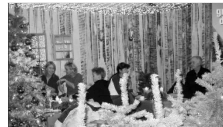
Gastronomie – weihnachtliche Stimmung und gute Laune.