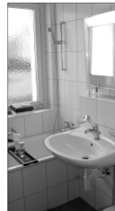
Das moderne Bad.

Wohnungen, das Angebot reicht von der Zweieinhalb-Zimmer-Wohnung bis zur Vier-Zimmer-Wohnung. Alle Wohnungen verfügen über einen Balkon.