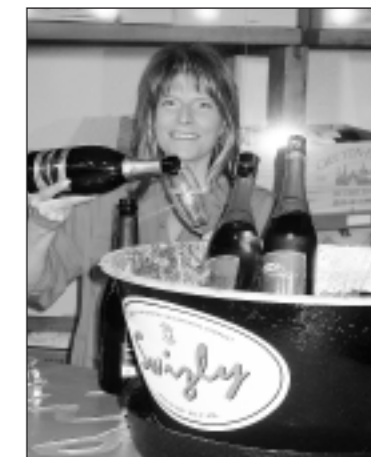
Möhl – Innovation und Charme.

Sicher – irgend etwas lässt sich immer verbessern! Doch eines ist gewiss: der 21. Arboner Weihnachtsausstellung war ein durchschlagender Erfolg beschieden. Die regionalen Aussteller zeigten sich von ihrer besten Seite, und die Vertreter der Gastregion Lienzer Dolomiten trugen ihren Teil zur rundum gelungenen Arwa bei. Zwar ist der Seeparksaal mit seiner ausgezeichneten Infrastruktur für eine Gewerbeausstellung nahezu perfekt, doch braucht es auch innovative Gewerbetreibende, welche ihre Produkte oder Dienstleistungen in einem gemütlichen Ambiente präsentieren. Und das haben sie wahrhaftig getan. Besonderes Lob verdient die Feuerwehr, die mit ihrem engagierten Auftritt noch mehr Sympathisanten gewonnen hat. – Die 21. Arwa hat ihre Tore geschlossen... auf Wiedersehen bei der 22. Auflage vom 29. November bis 3. Dezember im Arboner Seeparksaal!