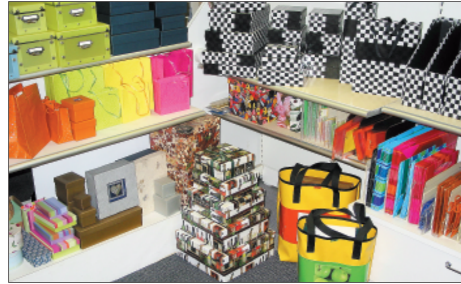
Wer schöne Verpackungen sucht, ist bei Mumenthaler an der richtigen Adresse.

ein kleines Sortiment an Büchern, doch werden Titel, die nicht vorrätig sind, in der Regel innert 24 Stunden besorgt. Auf der Bestsellerliste stehen derzeit Werke von Arno Geiger (deutscher Buchpreis 2005) und Nobelpreisträger J. M. Coetzee, und besonders gefragt ist der Thriller «The Scorpion's Gate» von Richard A. Clarke. Bei den Sachbüchern ist der Weltatmanach «Zahlen – Daten – Fakten 2005» von Fischer zu erwähnen, und aus den zahlreichen Kinderbüchern sticht natürlich «Harry Potter und der Halbblutprinz» besonders heraus. Beim Stöbern bemerkt der Kunde auch die Vorliebe der Besitzer: Reiseführer und Kochbücher!