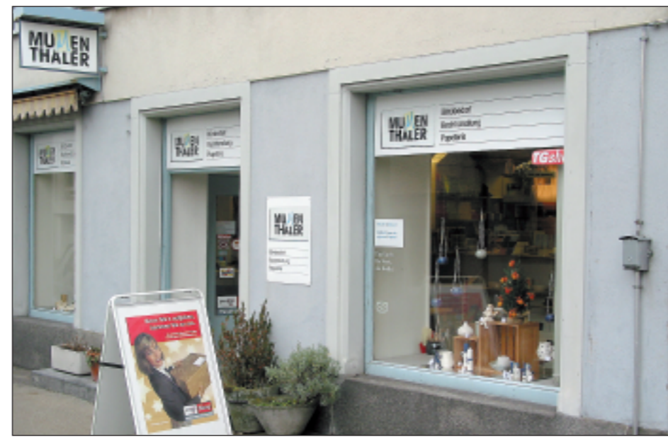
1801 wurde die Liegenschaft an der Rathausgasse 6 in Arbon erstmals erwähnt.