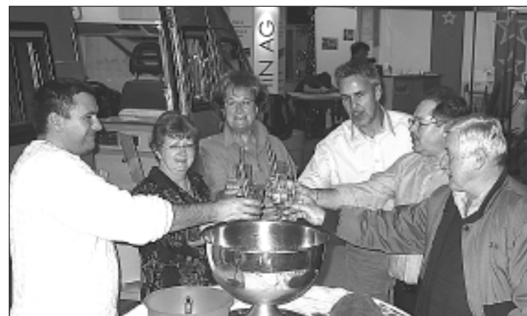
Arwa 2005: Man trifft sich in geselliger Runde und pflegt die Gemütlichkeit vor dem Wohnmobil von Camping Waibel AG!